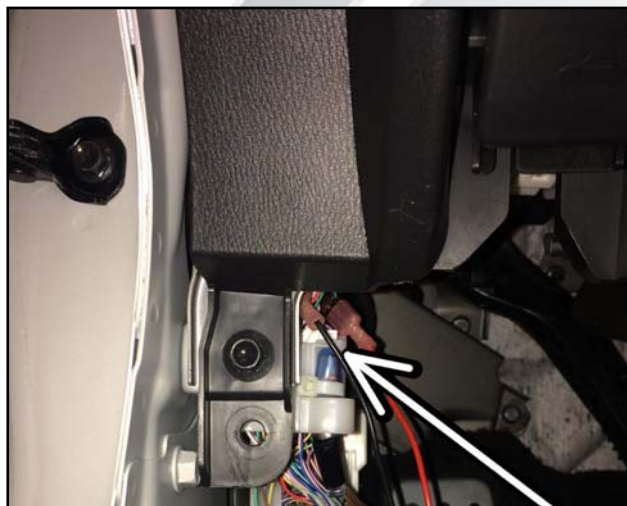
Stecker 1 + 2 Plug 1 + 2

Na het verwijderen van het voetpaneel worden de stekkers 1 en 2 zichtbaar. (pic 6 & 7)