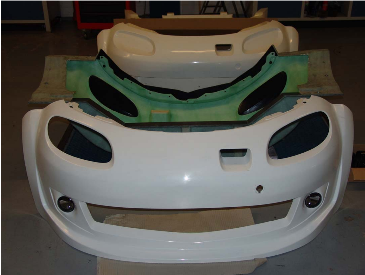
Der "zweite " Prototyp mit integrierten Nebelscheinwerfern und der dazugehörigen Form.