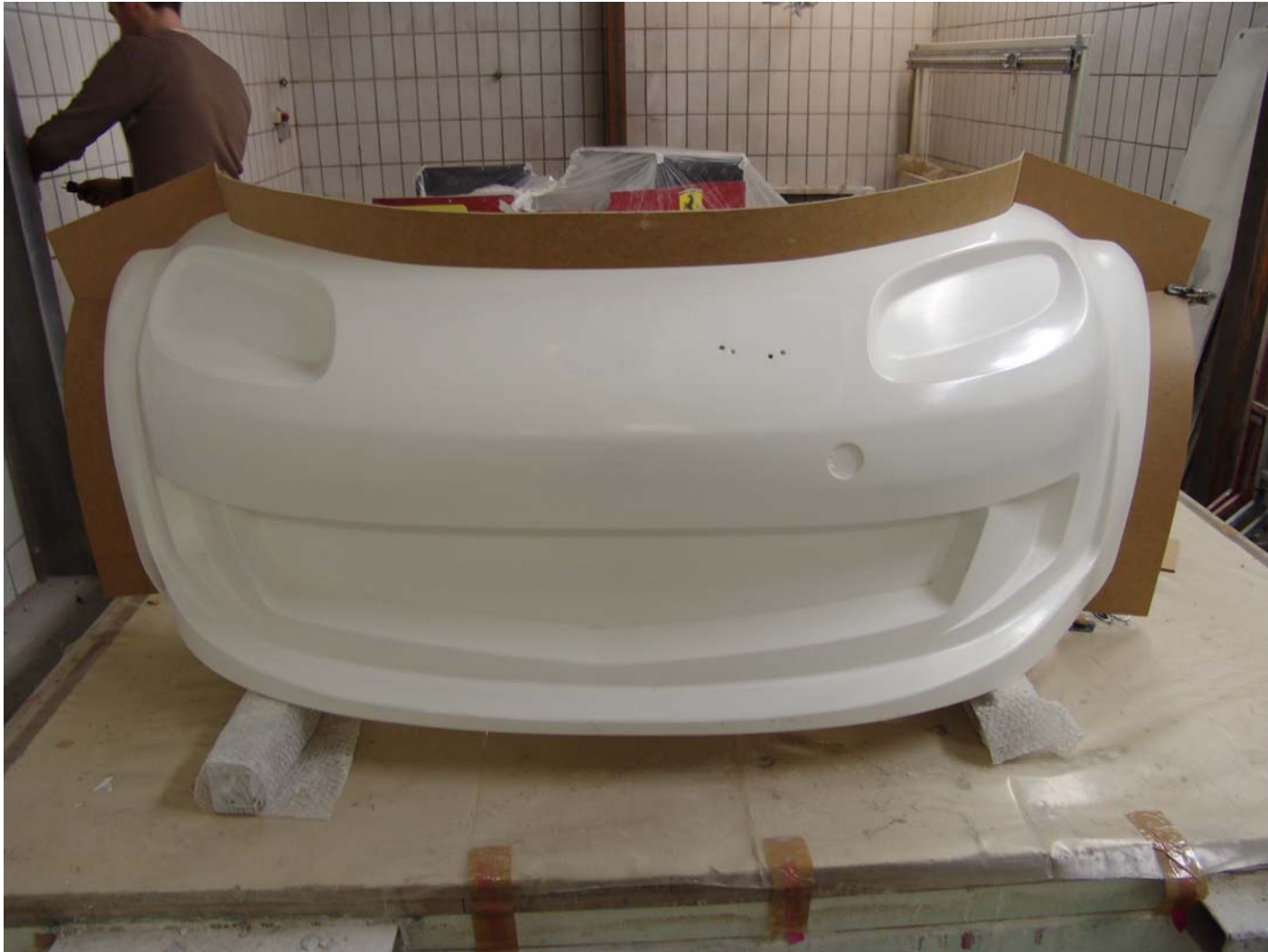
Komplett bearbeitetes und bereits abgeflanshtes Hartmodell. Fertig zum abformen.