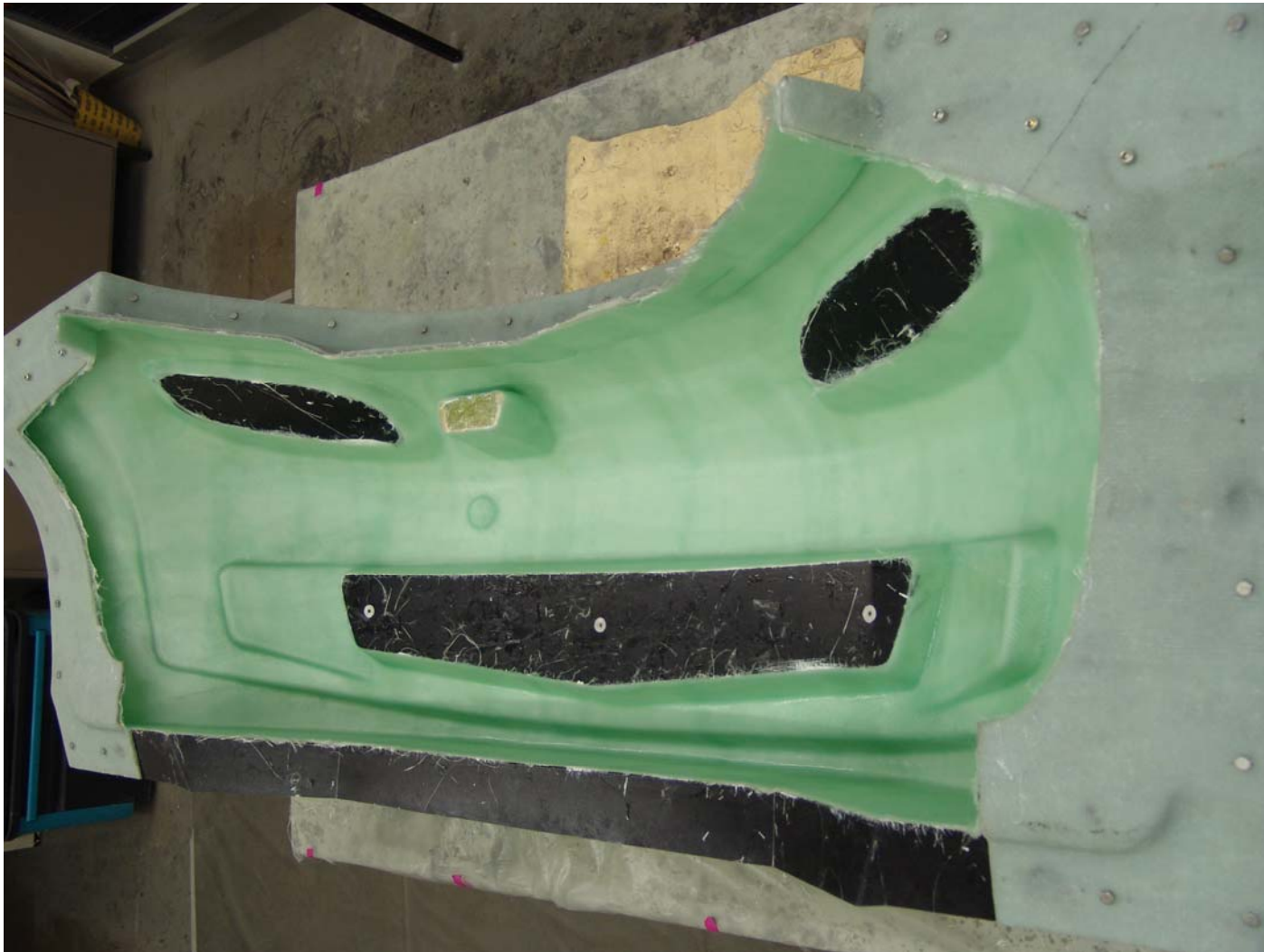
Laminat der ersten Frontschürze, "der Prototyp".