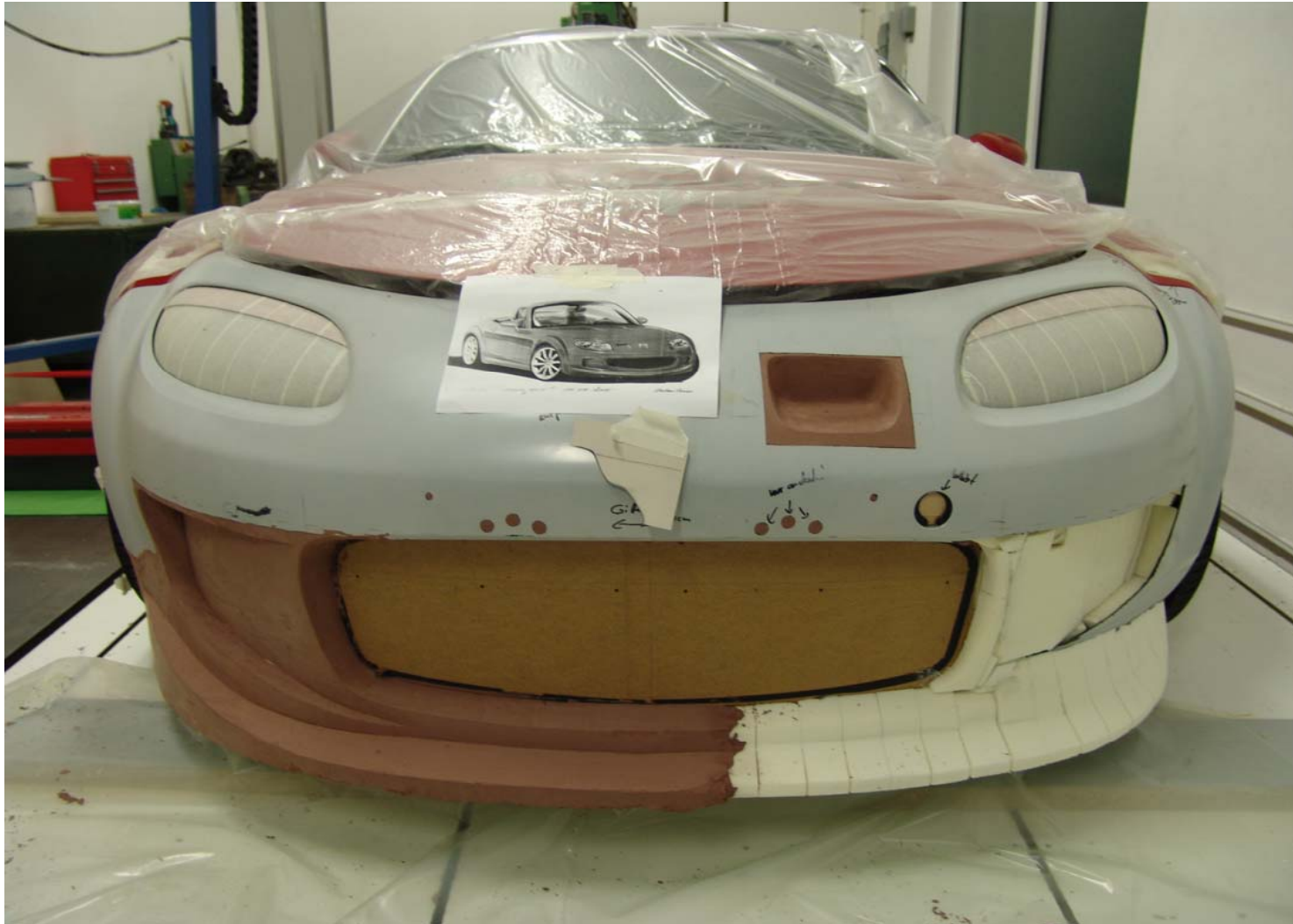
Zurecht geschnittene, mit Schaumstoff und Holz hinterbaute Original-Frontschürze die mit Clay modelliert wurde.