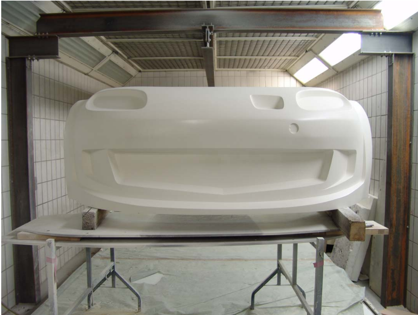
Fast fertig modelliertes Hartmodell.