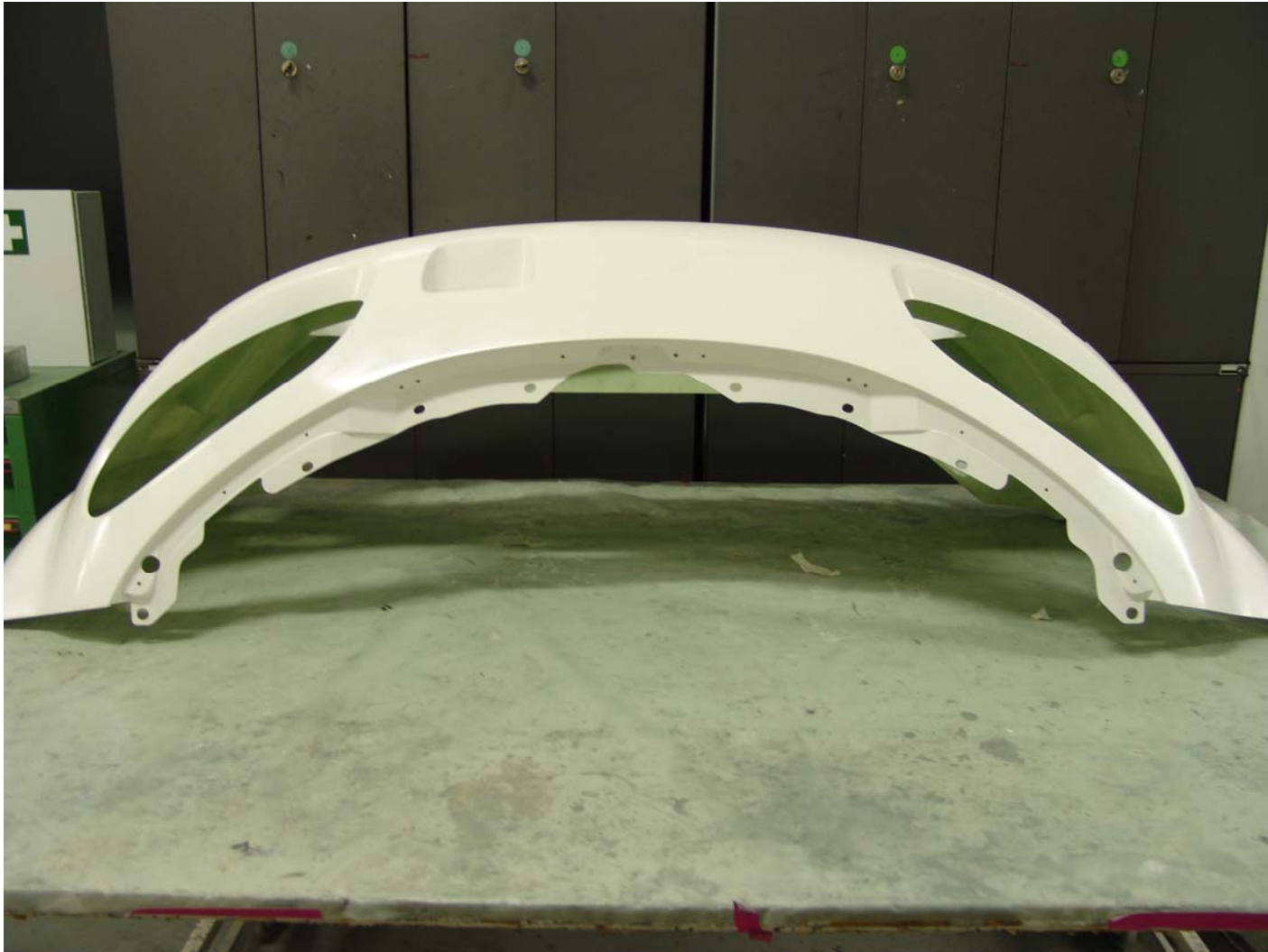
Die fertige Frontschürze mit allen Halterungsbohrungen.