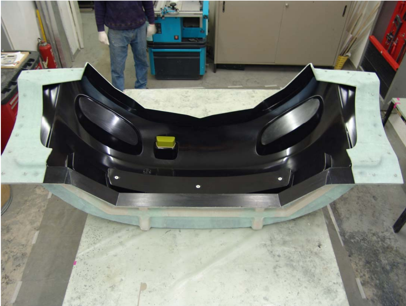
Fertige Form mit integriertem Air-Intake (Lufteinlass).