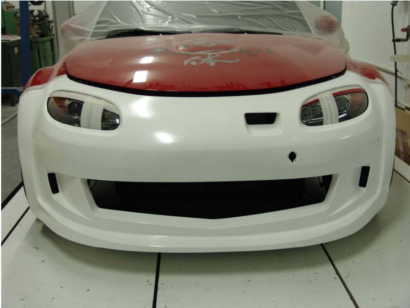
Der Prototyp zum anpassen an das Fahrzeug montiert.