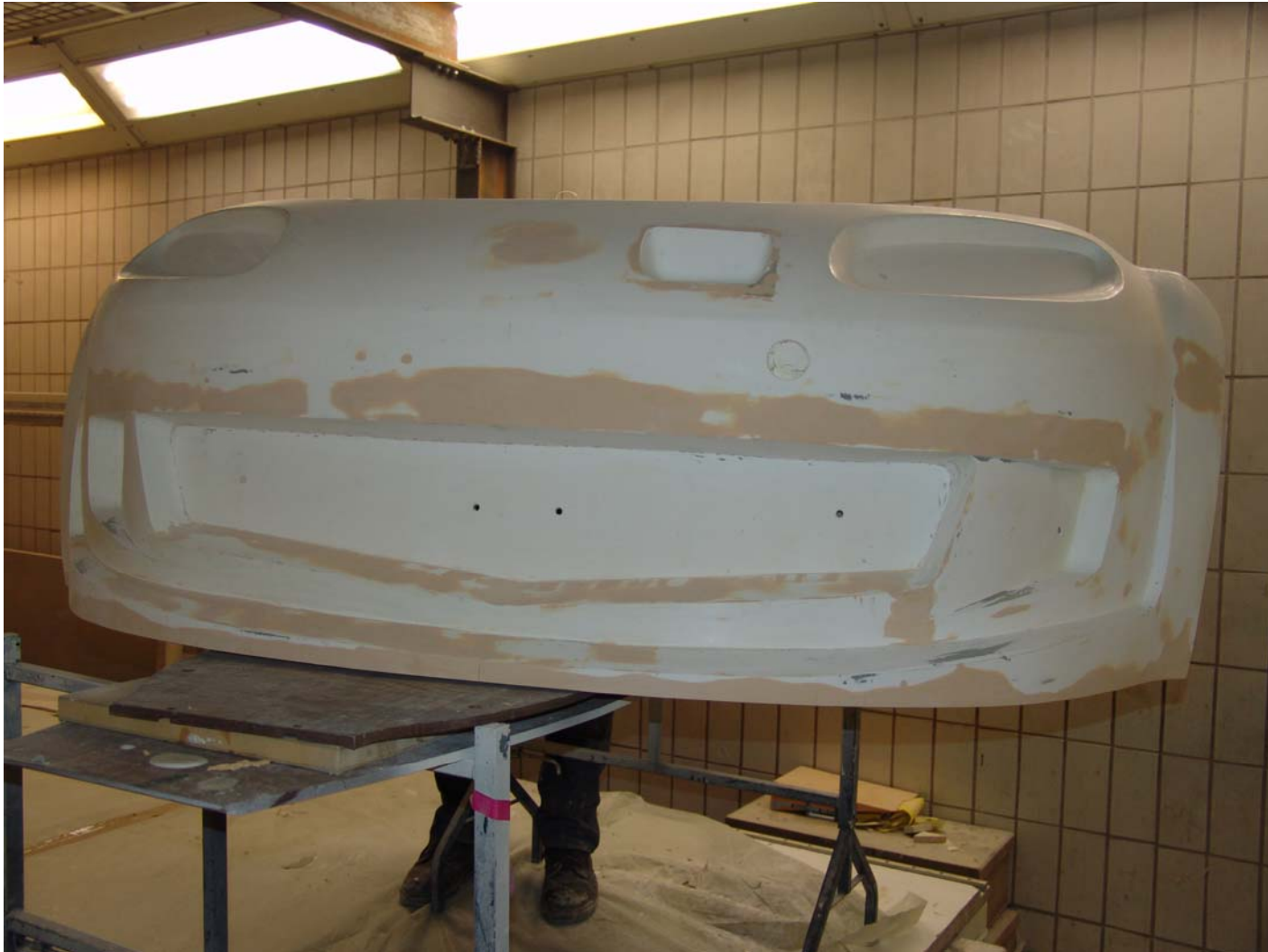
Das Hartmodell in Bearbeitung.