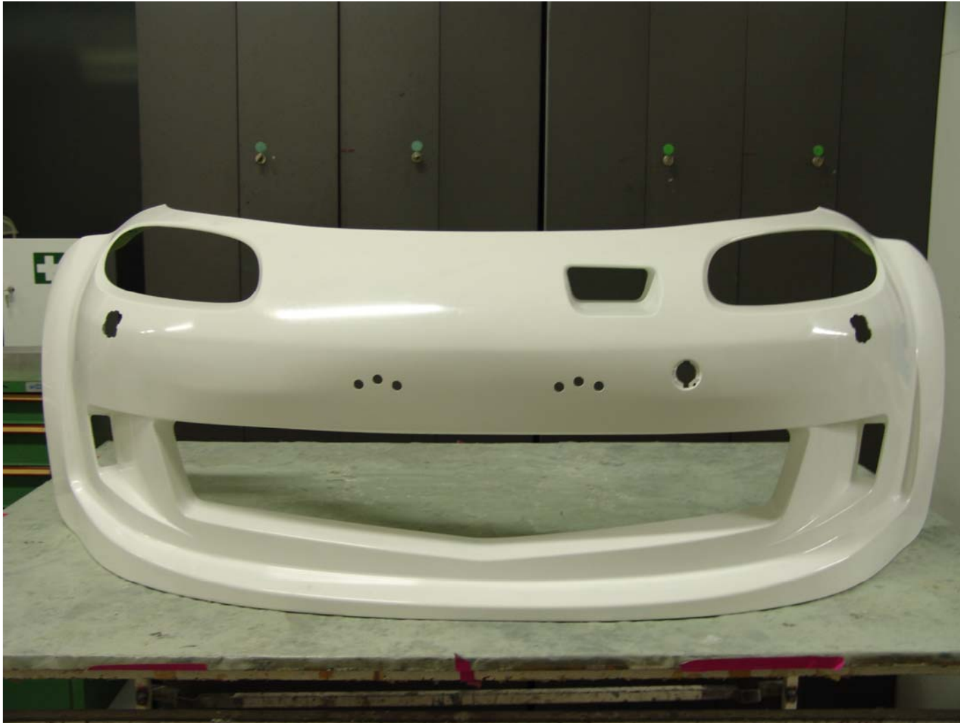
Frontansicht der fertigen Frontschürze mit allen Halterungsbohrungen und den seitlichen Lufteinlässen.