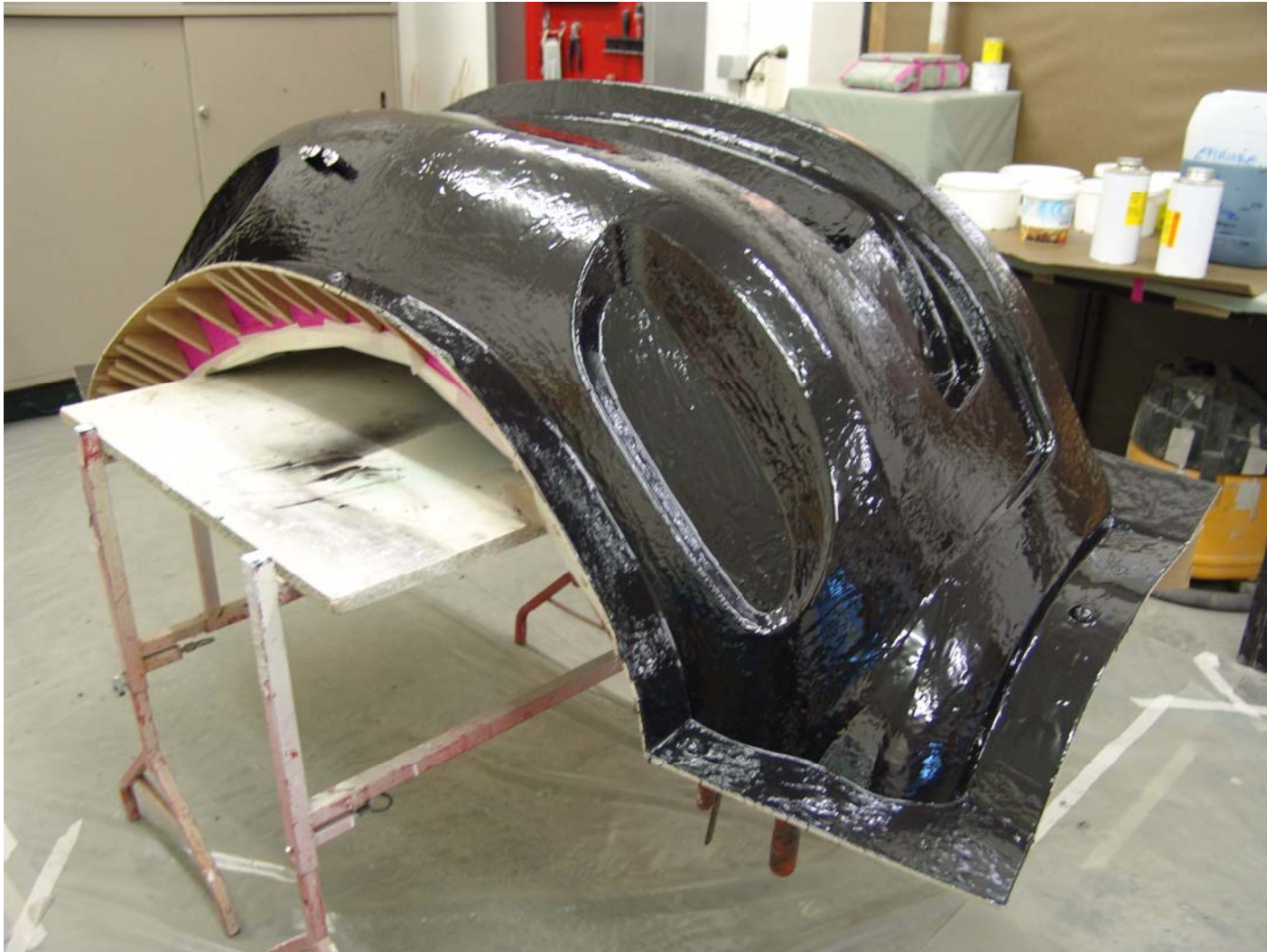
Das Hartmodell kurz vor der Erstellung der eigentlichen Form.