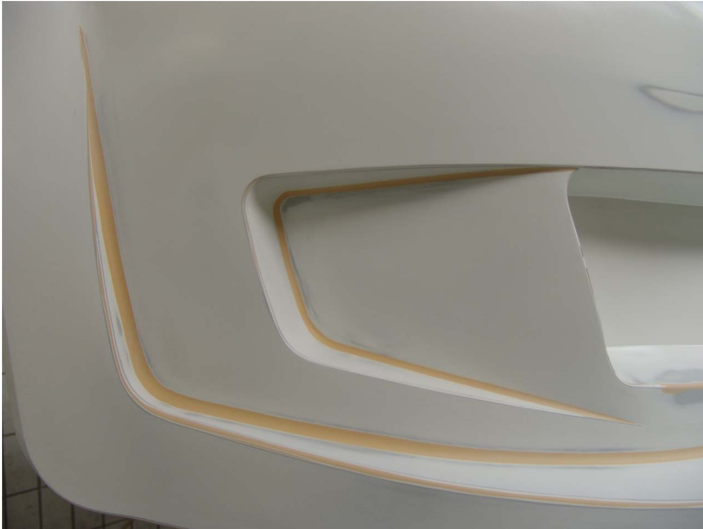
Einarbeitung der Radien in das Hartmodell.