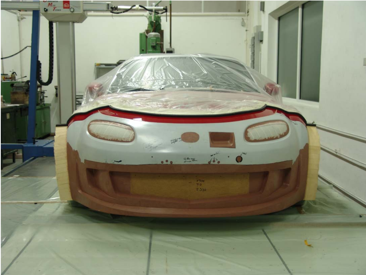
Das vollendete Claymodell.