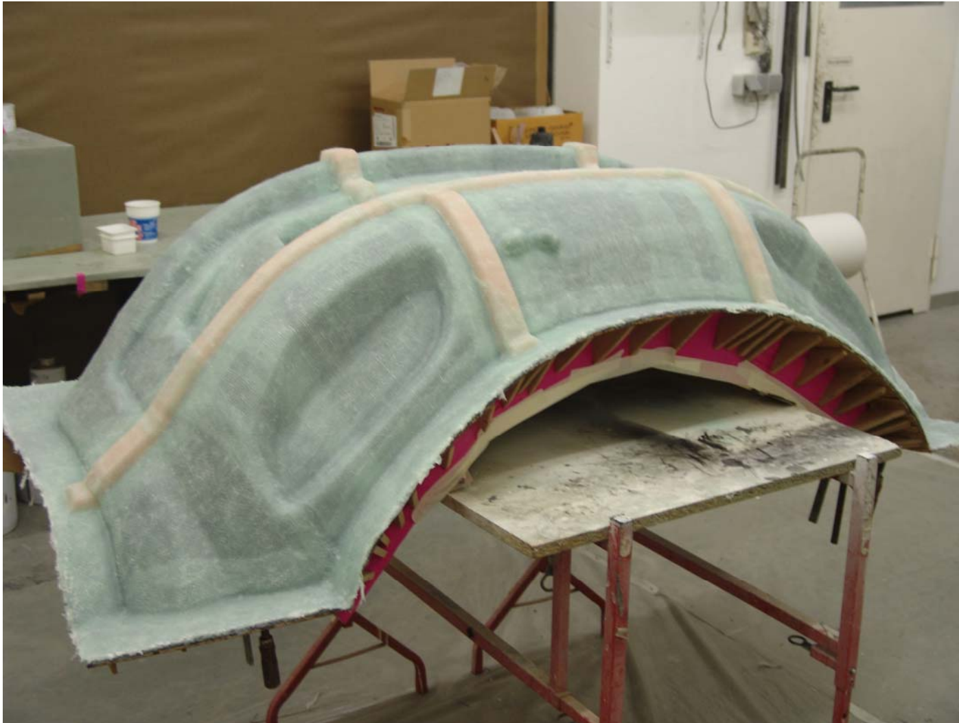
Das Formlaminat mit den Verstärkungsstreifen, welche für mehr Steifigkeit sorgen.