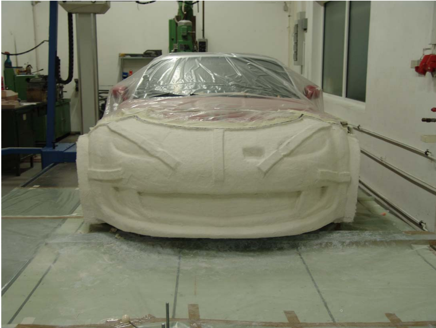
Fertige Gipsform mit integrierten Verstärkungen.